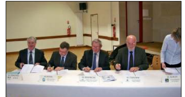
Signature du contrat de bassin versant par les financeurs