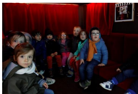
Dans la Caravane, on en prend plein les yeux !

Cette animation amorce l'instauration d'un véritable programme d'actions culturelles à la bibliothèque, notamment grâce au développement de partenariats locaux. Des projets d'expositions, de spectacles et d'ateliers participatifs sont en train de germer... alors restez connectés ! Les adhérents reçoivent régulièrement une newsletter d'information, et vous pouvez retrouver la bibliothèque de Pancé sur la page Facebook Bibliothèques Bretagne porte de Loire Cté ou encore sur celle de la commune de Pancé.