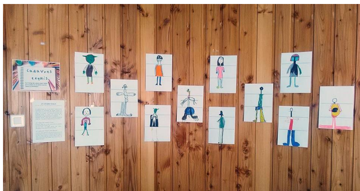
Cadavres exquis réalisés par les CE1-CE2, exposés à l'accueil de la bibliothèque... une légère influence Star Wars ?

Depuis janvier 2018, la bibliothèque accueille votre enfant scolarisé à l'école privée de Pancé, à raison d'une fois par mois. Ce temps d'accueil est pour lui l'occasion d'emprunter un livre de son choix, mais aussi de participer à de petits ateliers avec Mathilde : lectures, kamishibai, jeux optiques, création d'histoires, cadavres exquis... Ces ateliers peuvent ensuite donner lieu à de mini-expositions des travaux réalisés par les enfants à l'accueil de la bibliothèque, comme les savoureux cadavres exquis dessinés des CE1-CE2 !