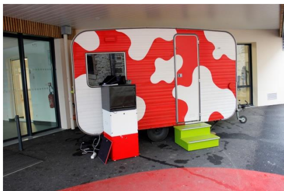
La Caravane ensorcelée à Pancé