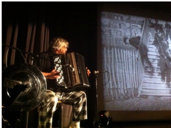
Ciné-concert de cinémaniak

Il y a 120 ans, les frères Lumières inventaient le Cinéma ouvrant la porte à toute l'évolution qu'a connu cet art depuis. C'est peut-être cela qui a inspiré le thème 2015 choisi par les 14 membres de l'association du JourJ... Aussi grâce aux 20 ans d'expérience de la Compagnie Cinémaniak (72) vous pourrez vous projeter, le 19 Septembre prochain, dans les premières années du cinéma. Attractions, exposition viendront agrémenter les projections dont les musiques et voix seront réalisées en direct par les artistes de la Compagnie.